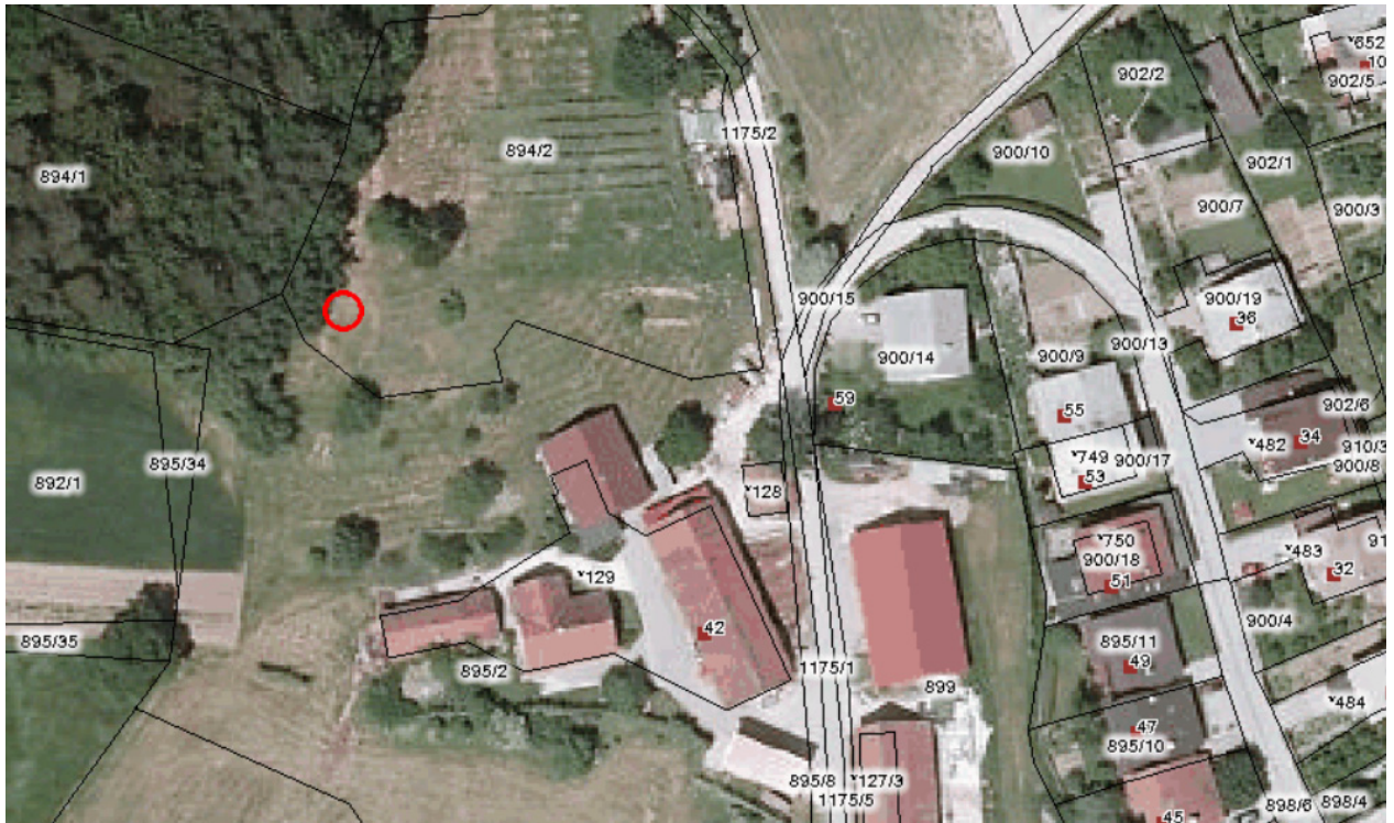
Bazna postaja NE-2506 A - Ostrožno (Greenfield)